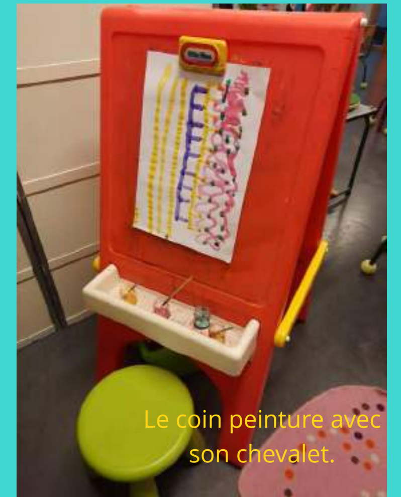
Le coin peinture avec son chevalet.