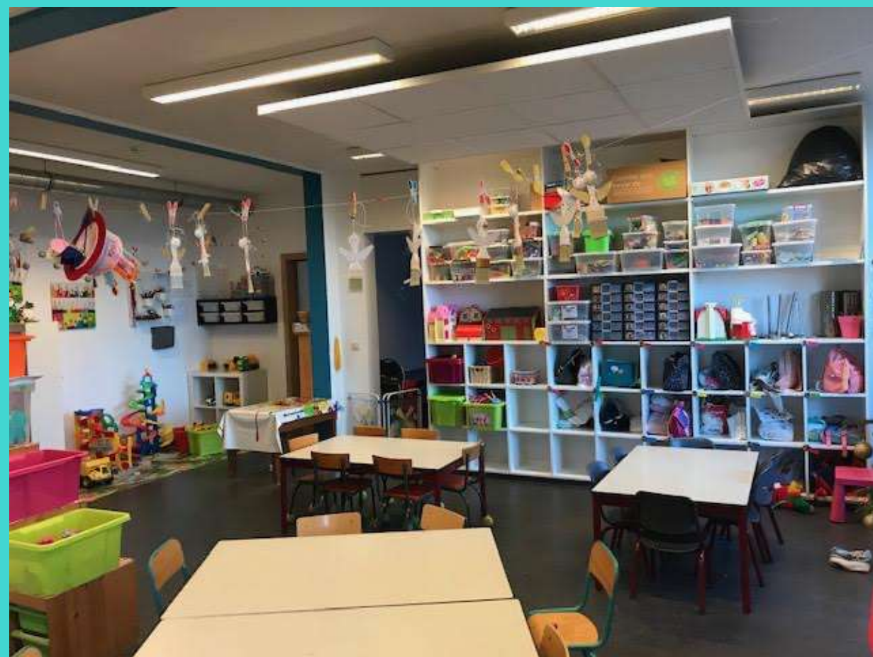
Les tables pour les ateliers, les collations, les dîners...