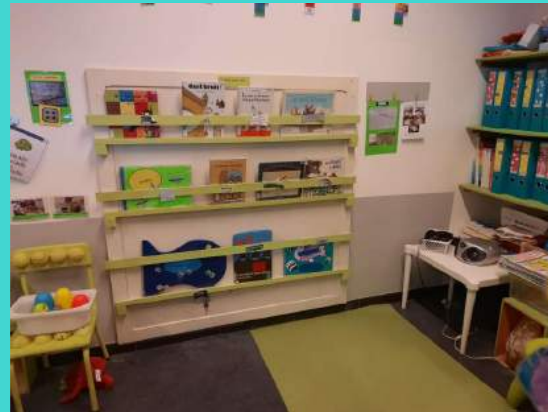
Le présentoir des livres dans le coin bibliothèque.