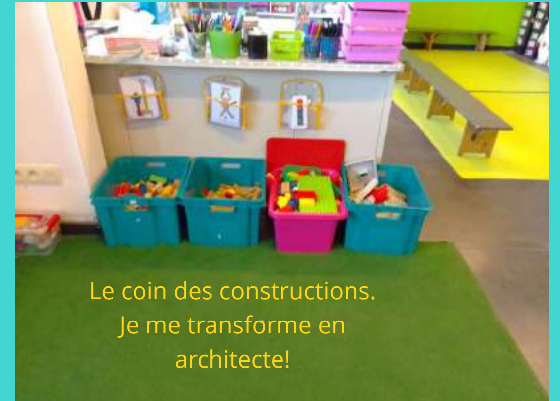
Le coin des constructions. Je me transforme en architecte!