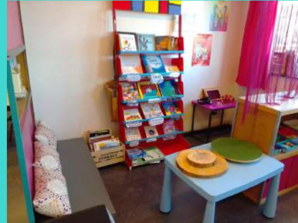
Le coin bibliothèque. Je peux aussi écouter des histoires grâce à la tablette.