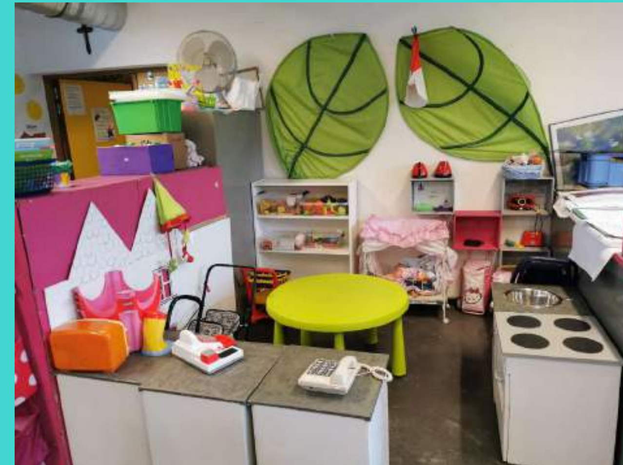
Le coin des jeux symboliques. Cuisine, poupées... Les enfants imitent les adultes.