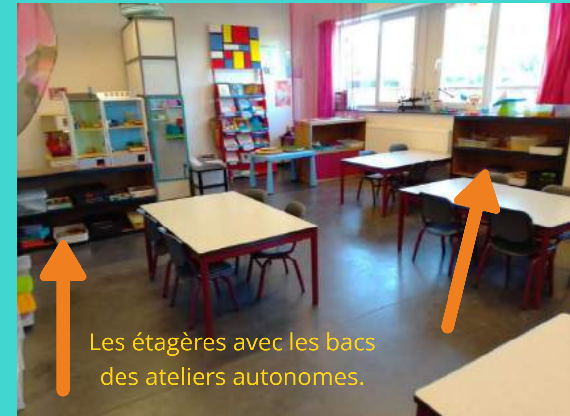
Les étagères avec les bacs des ateliers autonomes.