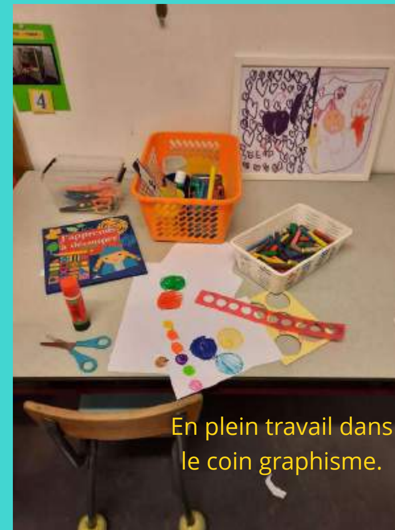
En plein travail dans le coin graphisme.

L'enseignante actuellement en 3ème maternelle reprendra l'année suivante une classe de 2ème maternelle.