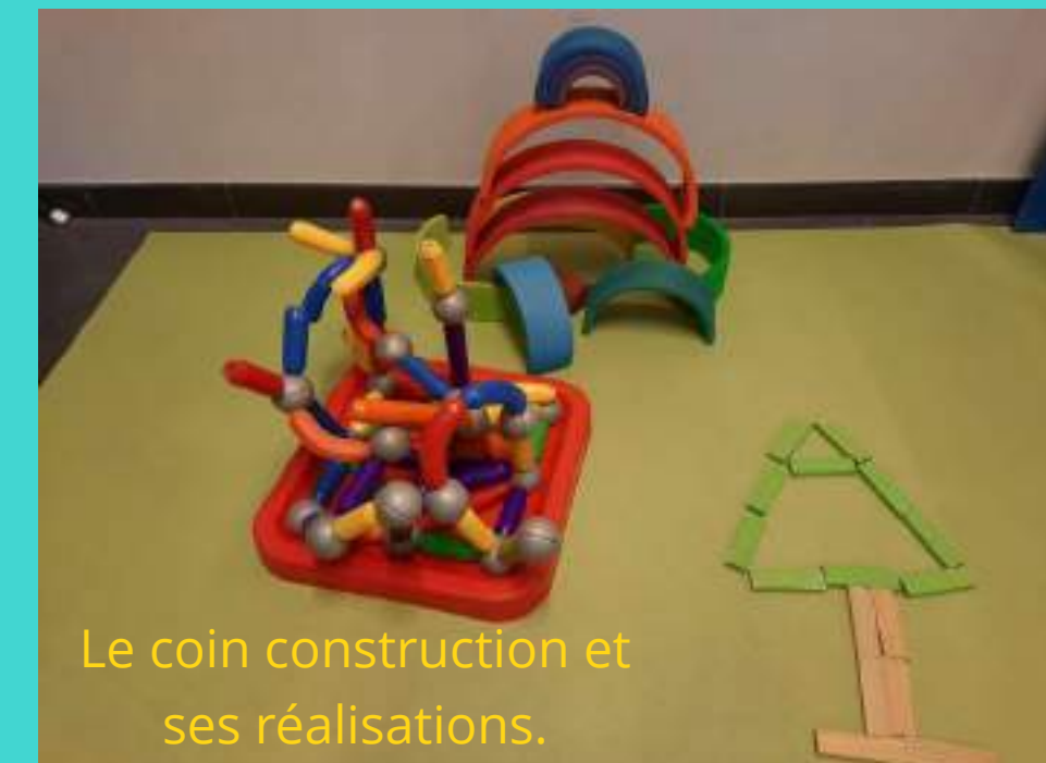
Le coin construction et ses réalisations.