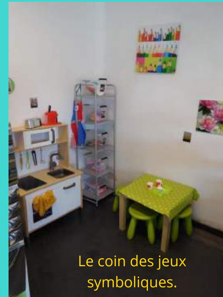
Le coin des jeux symboliques.