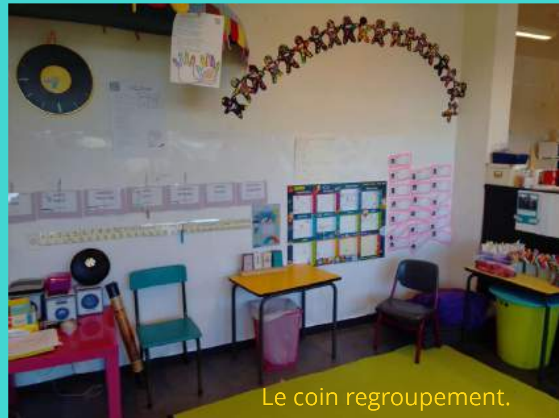
Le coin regroupement.