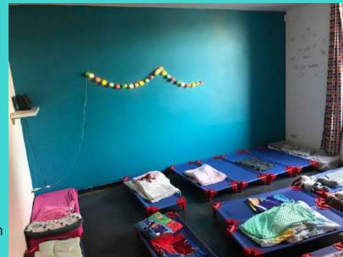
Le coin sieste pour un bon repos bien nécessaire à mon développement.