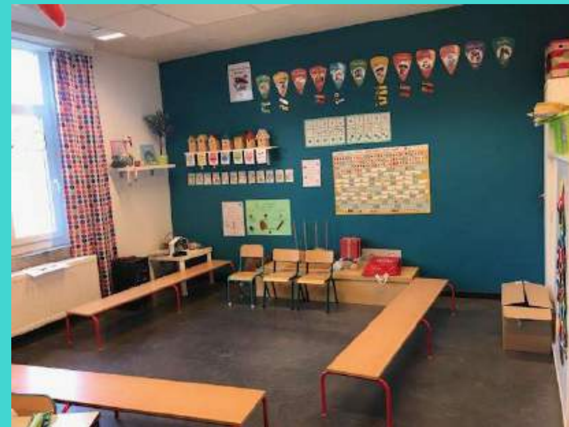
Le coin regroupement. Nous nous y rassemblons pour toutes les activités que nous partageons tous ensemble.