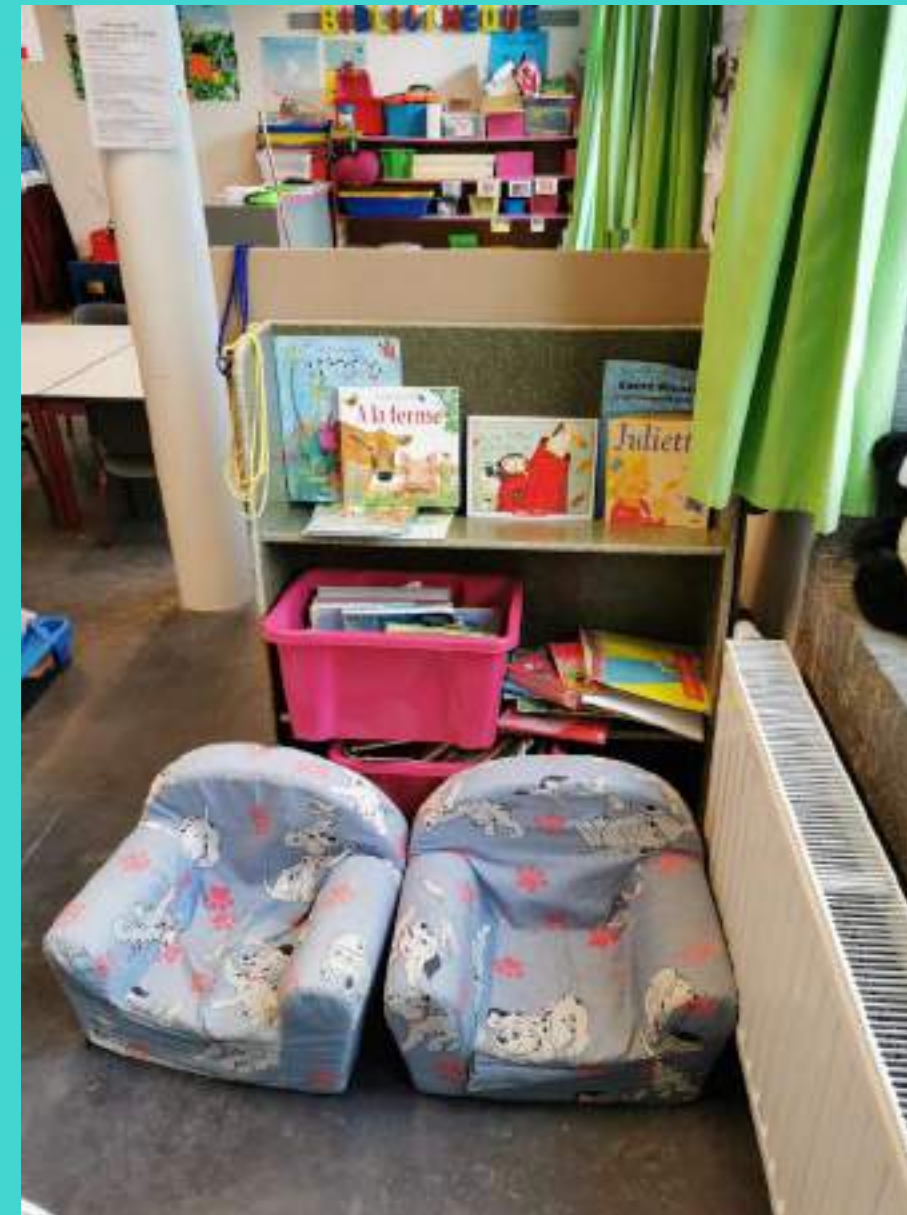
Le coin bibliothèque. Je peux relire un livre que Madame nous a lu.