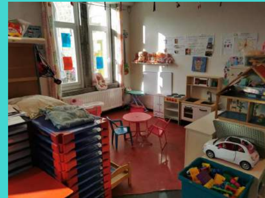
Le coin des jeux symboliques. Les lits pour la sieste.