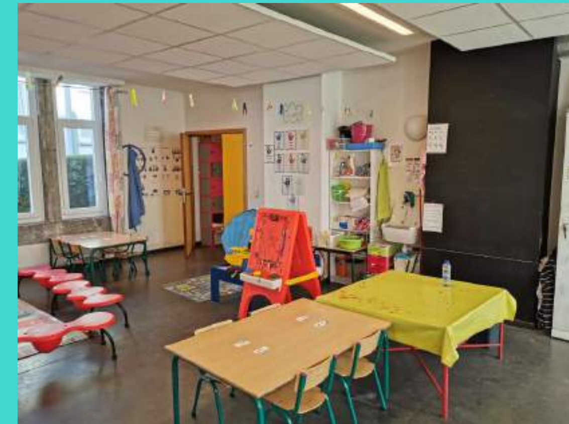
Le chevalet pour la peinture en plan vertical.