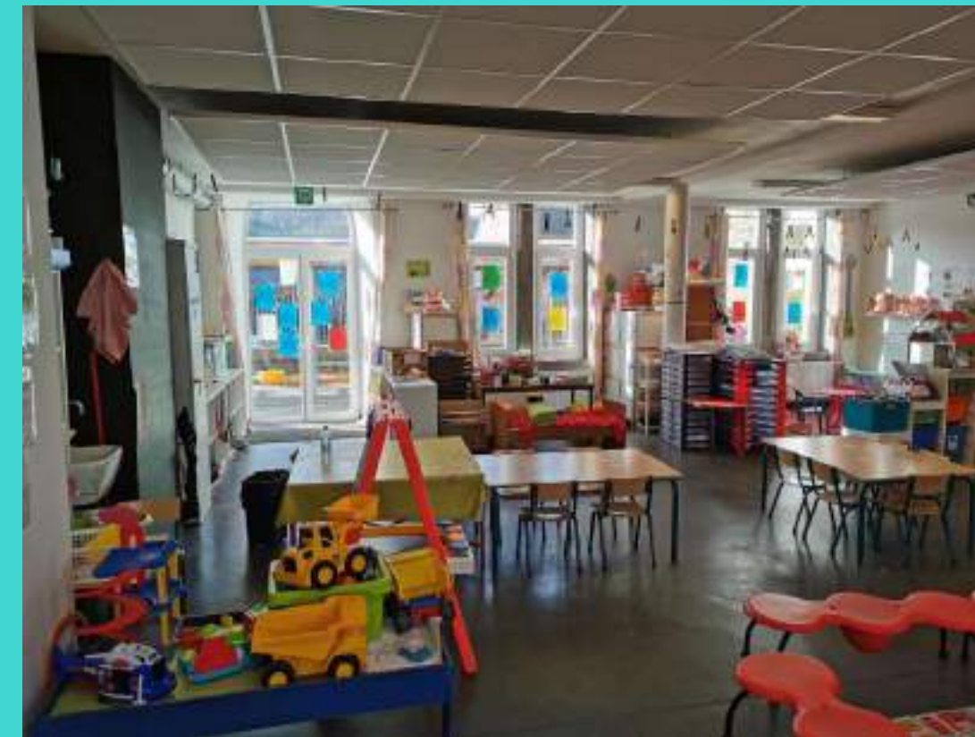
Quel bonheur, des gros engins à manipuler.