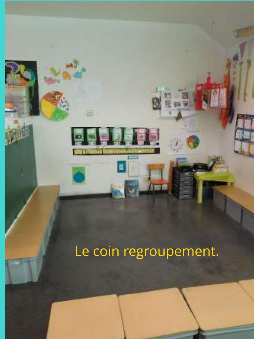
Le coin regroupement.