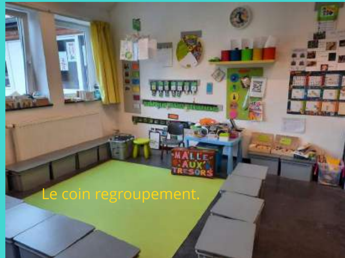
Le coin regroupement.