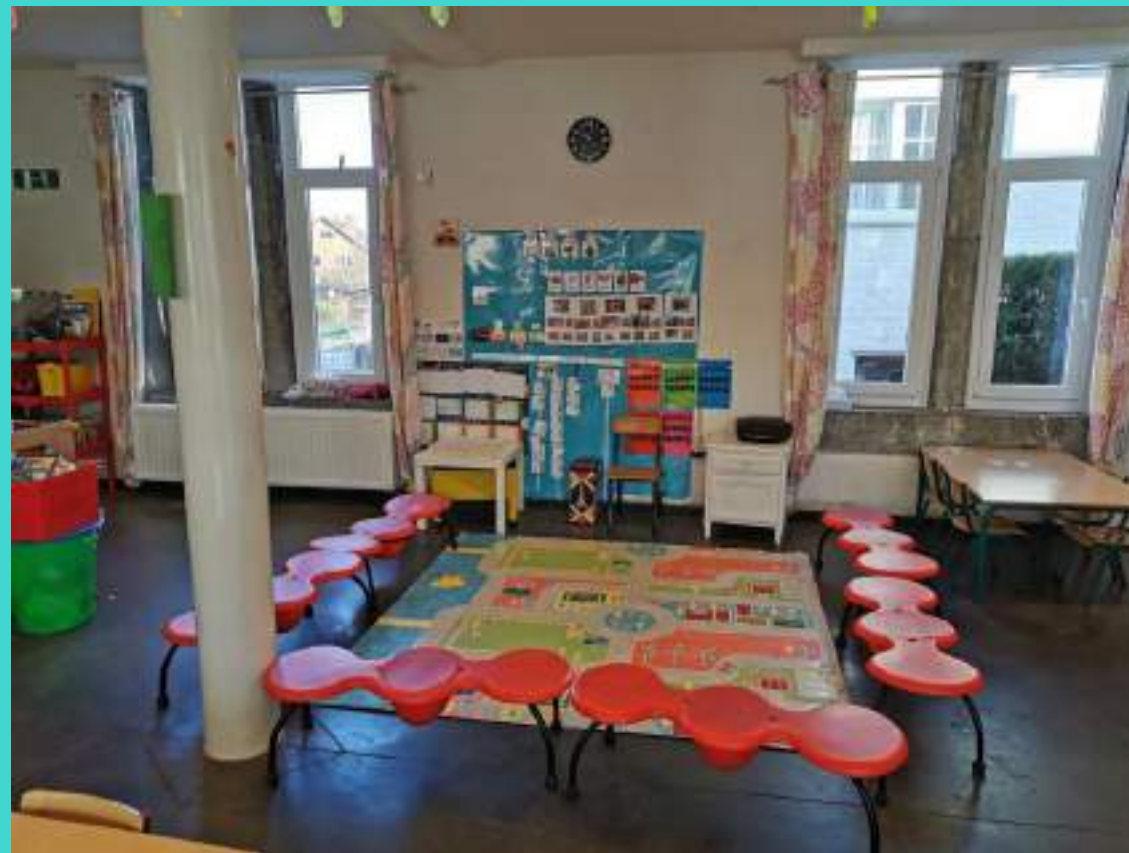
Le coin regroupement.