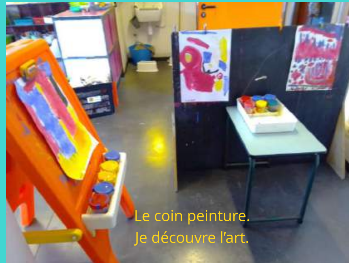
Le coin peinture. Je découvre l'art.