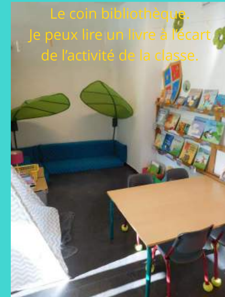
Le coin bibliothèque. Je peux lire un livre à l'écart de l'activité de la classe.