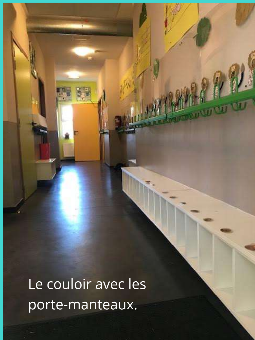
Le couloir avec les porte-manteaux.